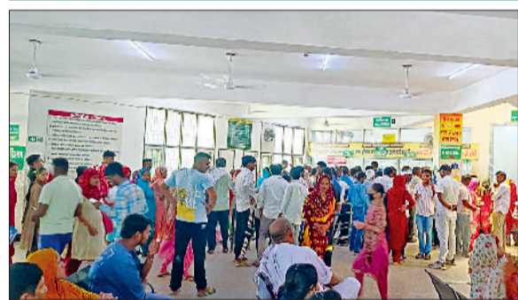
जींद। नागरिक अस्पताल में ओपीडी पर्यो के लिए लगी मरीजों की लंबी लाइन।