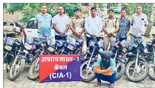
कैथल। बाइक चोर आरोपी सीआईए-1 पुलिस गिरफ्त में