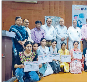
उचाना। भाषण प्रतियोगिता में विजेता प्रतिभागी।

■ कैथल, हिसार, जींद जिले के महाविद्यालयों से पहुंचे प्रतिभागी