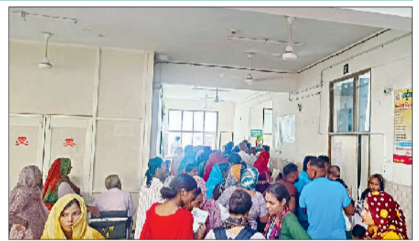
जींद। चिकित्सक कमरों के बाहर लगी मरीजों की लाइन।

आई वार्ड के प्रभारियों से उनके सामान और शिफ्टिंग को लेकर बातचीत की और सामान उठाने के लिए चतुर्थ श्रेणी कर्मियों का प्रबंध करने का निर्देश दिया। पहले ईसीजी वार्ड व मेंटल हेल्थ कमरे के सामान को शिफ्ट किया जाएगा। इसके बाद