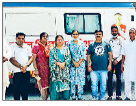
मेडिकल वैन के साथ टीम सदस्य।

■ नवीन जिनदल फाउंडेशन द्वारा गांव में लगाया गया शिविर।