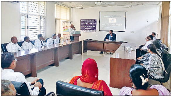
कैथल। बाल विवाह रोकने को लेकर प्रशिक्षण कार्यक्रम में उपस्थित अधिकारी