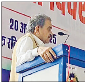
जींद। कार्यकर्ताओं को संबोधित करते हुए पूर्व केंद्रीय मंत्री बीरेंद्र सिंह।

पूर्व केंद्रीय मंत्री बीरेंद्र सिंह ने कहा कि अगर ये नेता कांग्रेस को मजबूत करने के लिए काम करेंगे तो हमारे साथी सिर-आंखों पर बैठाएंगे, लेकिन यदि वे ऐसा नहीं करते हैं तो फिर उन्हें घर से बाहर नहीं निकलने देंगे। बीरेंद्र सिंह ने कहा कि राहुल गांधी की भारत जोड़ो यात्रा की जर्ज पर हरियाणा में कांग्रेस को जानो पैदल यात्रा निकाली जाएगी। बीरेंद्र सिंह बुधवार को रिवदास धर्मशाला में राजीव गांधी की जयंती पर