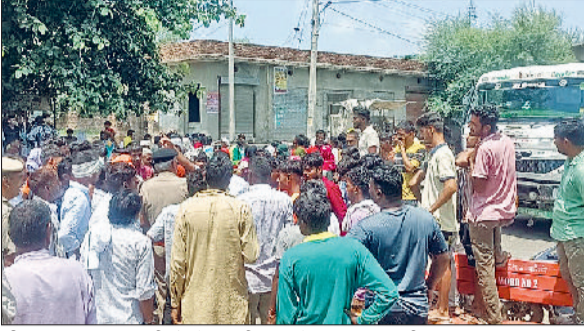
जींद। जाम लगाए ग्रामीणों से बातचीत करते हुए पुलिसकर्मी।

ग्रामीणों ने मामले की निष्पक्ष जांच करने व दोषियों के खिलाफ कार्रवाई की मांग