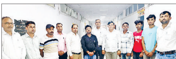
कैथल। जाट आईटीआई के चयनित विद्यार्थी कंपनी अधिकारियों के साथ